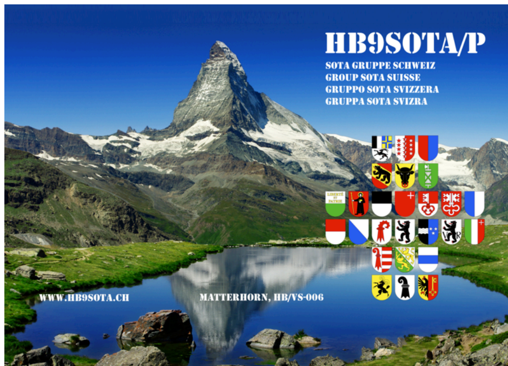
Bild der neuen HB9SOTA-QSL-Karte