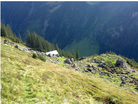
Blick zurück zur Bütz. Etwas unterhalb vom Brunnen aufgenommen.