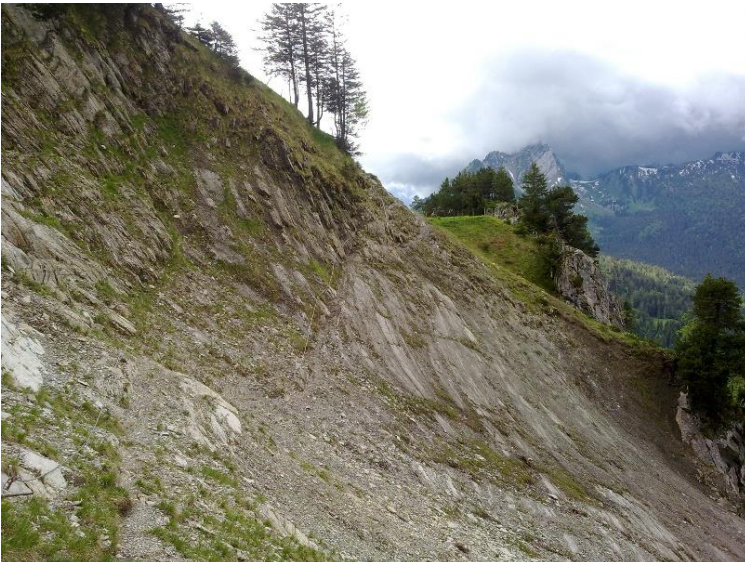
Der Aufstieg bis Jöggelisberg ist problemlos. Nach Jöggelisberg, Querung einer Geröllhalde. Zur Sicherung ist ein Drahtseil montiert. Nach der Querung führt der Weg nach rechts auf den Grat.