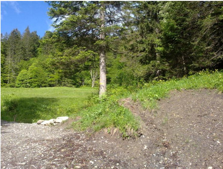
Abzweigung nach Badhus, Richtung Jöggelisberg.