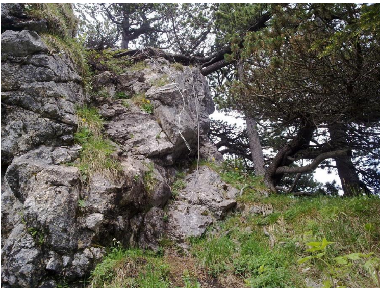
Auf dem Gipfelgrat gibt es eine Felsstufe zu überwinden. Ein Drahtseil und ein altes Kletterseil sind an einer Baumwurzel befestigt (zuerst testen).