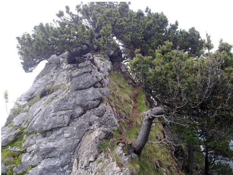
Der Grat kurz vor dem Gipfel. Der Weg rechts, durch die Bäume. Im Aufstieg bewölkt aber trocken. Beim Abstieg im Wald vor dem Badhus setzte Regen ein.