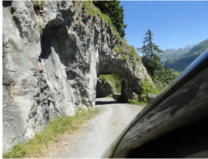
B2: Tunnel durch den Fels