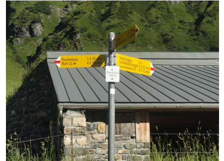
B3: Ein Stall und Wegweiser bei Obersiezsäss links geht es nach dem Risetenpass