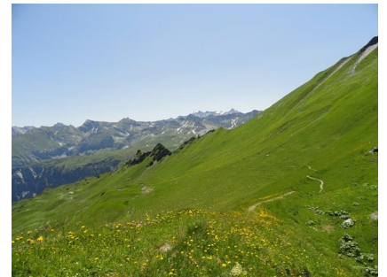
B7: Vom Risetenpass Richtung NE aus gesehen- Anstieg