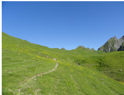
B6: Pfad zum Pass