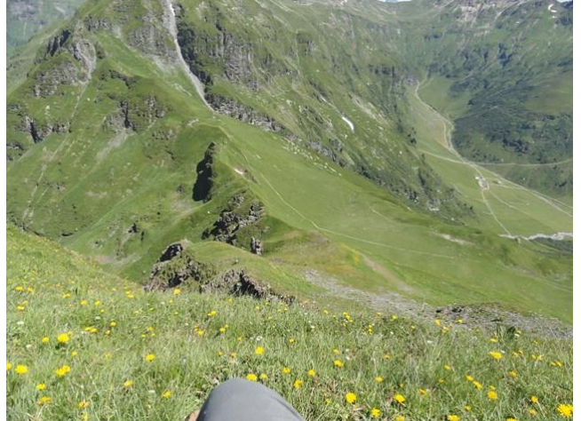
B9: Beinahe oben ö Blick zum Risetenpass hinunter. Man erkennt, dass man beim Steinbruch links auf der Wiese nahe Grat besser vorbeikommt.