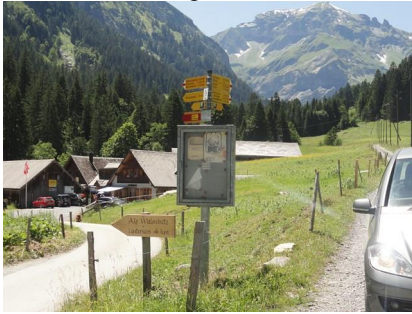
B1: Vor Vorsiez - recht nach Obersiezsäss!

Man fährt ins Weisstannental bis kurz vor Vorsiez. Vor dem Dorf hält man nach rechts. (B1). Dieser Weg geht bis nach Obersiezsäss. Es geht, meist auf einer Naturstrasse, teils auch geteert und durch ein Tunnel hoch.