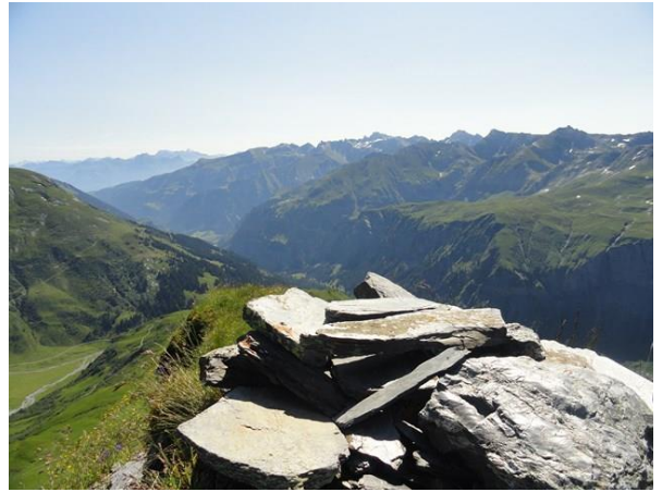
Top auf dem Risetenhore.

Im Nachhinein würde ich eher, eine Montagemöglichkeit etwas 5-10 Meter tiefer suchen. Da gibt es aber keine Steine oder Pfähle um den Antennenmast zu befestigen. Ausser man schlägt einen Hering oder Profilschiene in den Boden. (B10 - In der Mitte des Gupfes)