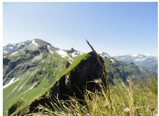
Beim Nachbars-Berg geht es auf der Nordseite gleich steil hinunter wie auf dem Südhang des Risetenhoren. (Vom Risetenhoren aufgenommen).

Nach SAC Skala würde ich das Stück Zwischen Risetenpass und Risetenhore etwa bei T4 einordnen.