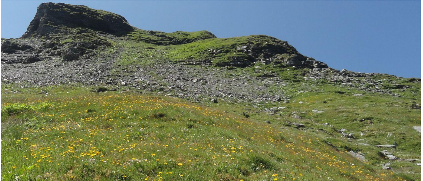
B10: Den Steinbruch aus Schieferstein habe ich ausgelassen. Nur oben beim Schattenansatz waren zwei Schritte zur Traversierung nötig gewesen. Den Weg habe ich mir vor dem Vorhügel und später eher rechts beim Grat gesucht. Denke es ist der logische Weg, einen Pfad erkennt man kaum. Oben geht es der unteren Schattenkante nach, die letzten Höhenmeter geht es dann links nach oben.