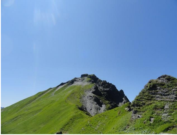
B8: Blick vom Risetenpass zum Risetenhore. Bis zum Steinbruch geht man den Pfad auf dem grasigen Grat.