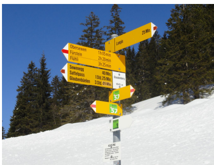
Der 57 er Weg