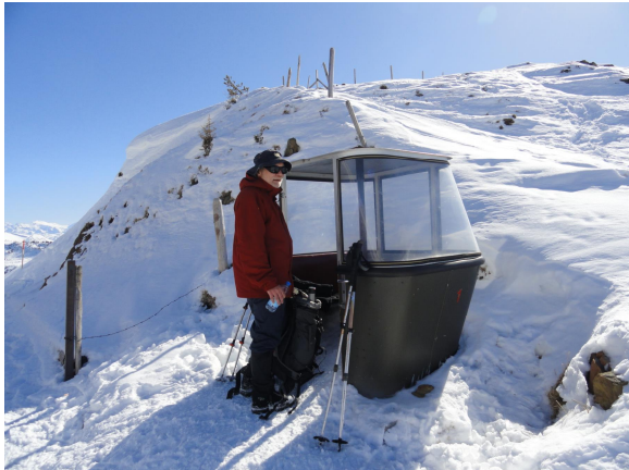
Am Sattel die Militär Sesselbahn