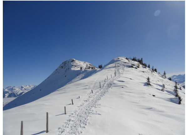
Von der Seilbahnkabine Richtung Trogenegg