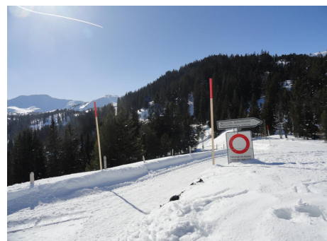
Die Abzweigung vom Glaubtenpass