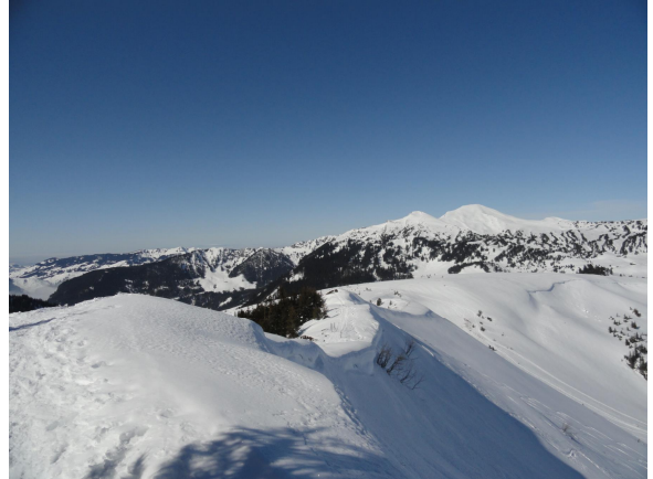
Weg Nr. 57 fast wie eine Strasse bis zur Seilbahnkabine