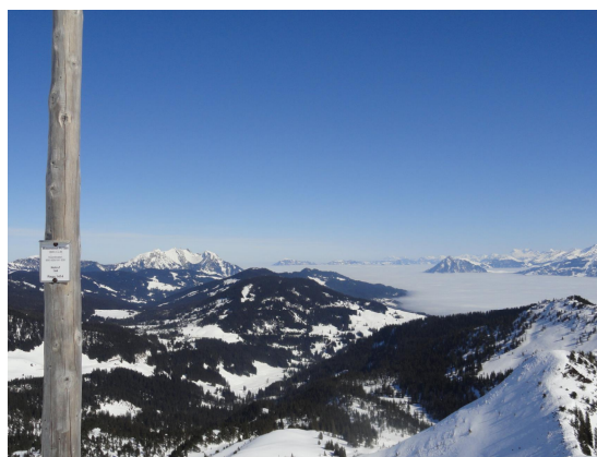
Alles unter 1300m war im dickem Nebel(Meer)