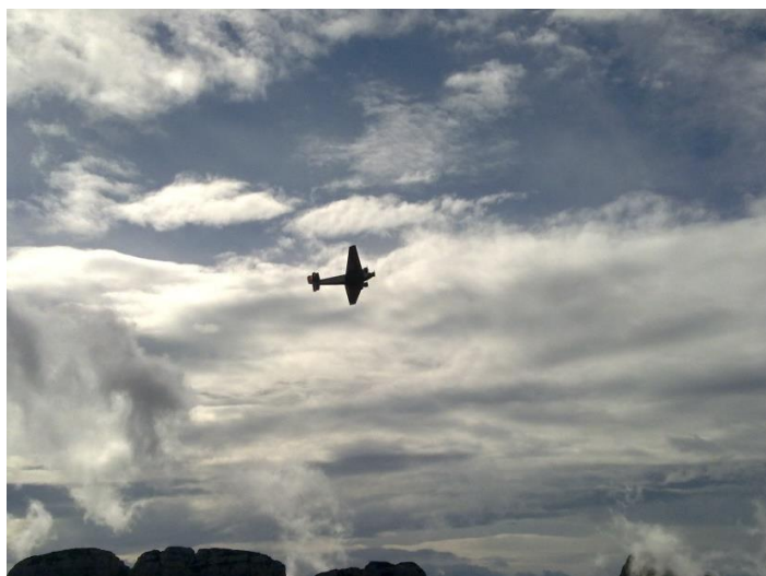
JU-52 im Steigflug