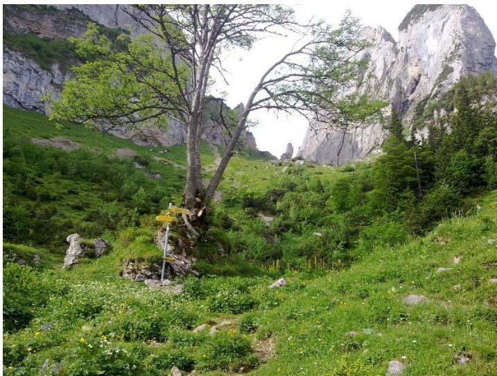
Bogartenlücke beim Wegweiser Mar, 1433m.