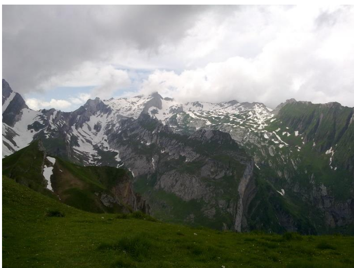
Säntis von Osten

Viele S2S QSO's mit HB9 Stationen. Leider ist mir gleich zu Beginn eines Pile-ups die Antenne durch einen Windstoss umgefallen. Hatte sie nur mit Steinen fixiert. Ich war aber mehr als 2 Stunden QRV und konnte das Verpasste nachholen.