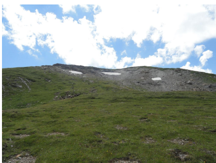
Nach dem Schnürli Grat, oben in den linken Felseinschnitt zielen.

Schnürli Grat: wie oben erwähnt, das letzte Stück Weg muss selbst ausgemacht werden. Sonst normaler Alpenweg.