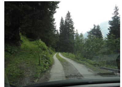
zwei betonierte Streifen am Schluss