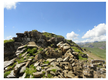
Auf das Wissgandstöckli ist der Weg manchmal steinig aber nie gefährlich. Kann ihn nicht klassifizieren.