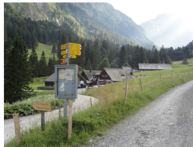
Wegweiser nach Obersiezsäss