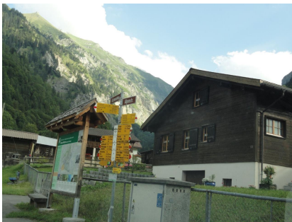
Weisstannen recht shalten

Mit dem Auto fährt man ins Weisstannental bis nach Weisstannen. Im Zentrum Dorf setzt man die Strasse nach rechts fort (B.u.L.) Man fährt bis Strasse weiter bis kurz vor Vorsiez.