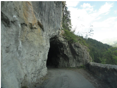
Es geht auch durch ein Tunnel