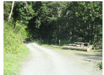
1. Teil Kiesstrasse