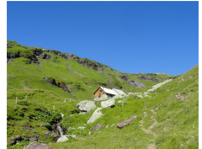
Bis zum Chammhüttli gibt es in der Nähe des Weges immer ein Bach.