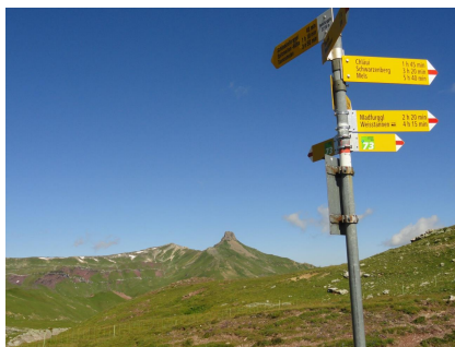
Fansfurggla Wegweiser, Links direkter Weg auf den Grat welcher zum welcher Wissgandstöckli führt. (Hinunter gelaufen) Rechts geht es auf den Schnürli Grat, Geradeaus auf den Spitzmeilen (Hintergrund) Hier ist es wie auf einer Hochebene.

Schnürli Grat: Wegweiser rechts ab dem weiterhin gut markierten Grat-Weg folgen bis man etwa genau zwischen Siextfurggla und Hüender Fulegg den Weg verlässt und rechts in die Höhe nach dem Felsen oben zieht. Dieser Weg ist nicht markiert und kaum šlesbarō jedoch ohne Aussetzungen ungefährlich. Oben nach dem Felsen zeigt sich das Bild wie bei der Antennebefestigung unten angezeigt.