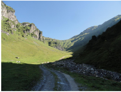
Gerade nach dem Parkplatz, geht der Weg bis zum hinteren Fels wo die rot weiss Markierung beginnt.