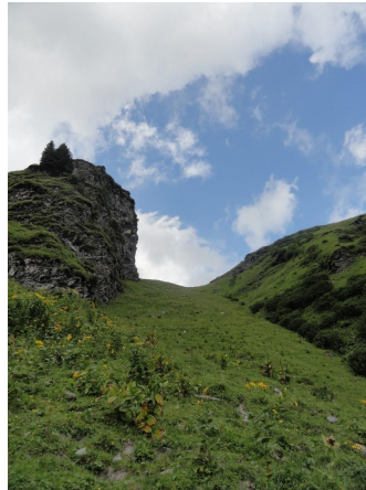
Anfangs geht ein Zick Zack Weg hoch. Es weiden Kühe auf dieser relativ steilen Alp. Nach dem Ausschnitt sieht man bald einmal die Chammhütte.