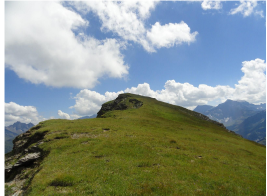
Schnürliigrat: Hier leider kein Foto gemacht. Jedoch Mast an dem einen Felsbrocken befestigt den es gibt. (gebastel) Kein Kreuz oder andere Hilfsbefestigungen gesehen!