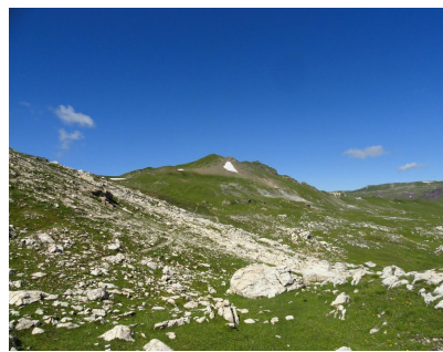
Wegart zum Grat welcher auf das Wissgandstöckli führt, links nach oben in meinem Fall nach untern gelaufen.