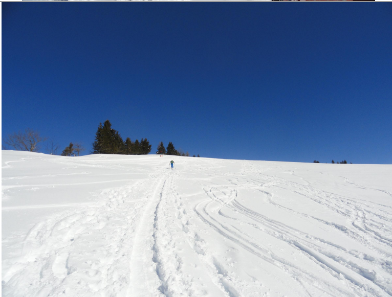
Das letzte Stück bis zum Kulm