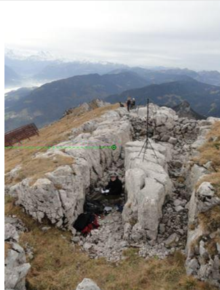
Leicht unterhalb, durch die Felskonstellation gibt es einen windgeschützten Platz.