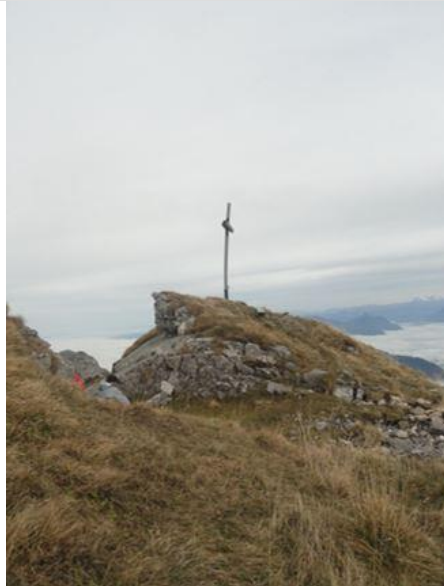
Gipfelkreuz und einen weiteren Masten mehr links davon. Die Nische davor gibt auch Windschutz