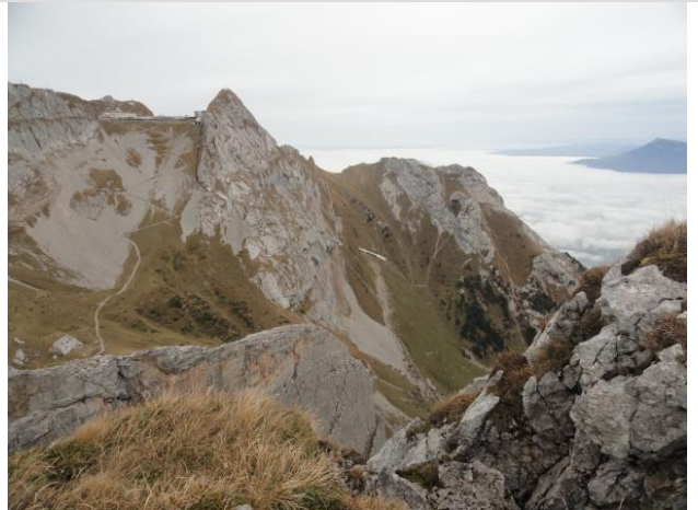
Pilatus vom Matthorn her gesehen