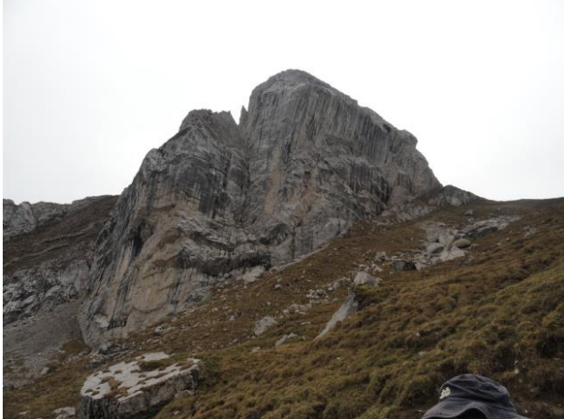
Matthorn von der Sattel zwischen dem Pilatu und dem Matthorn her gesehen. Chilesteinen 1865 m

Geplant war nach dem Tomlishorn LU- zu gehen und bei Lust vom Pilatus her, nach Chilesteinen hinab- und wieder auf das Matthorn hinauf zu laufen. Aus der Wettersituation heraus wollten wir rasch, mit der Luftseilbahn von Kriens, her über die Nebeldecke kommen. Ein Hinweis von Paul DST kurz vor dem Start um 6 Uhr: Die Luftseilbahnen ist doch wegen Revision geschlossen! Luftseilbahnen stellen den Betrieb zwischen Herbst- und Wintersaison sehr oft ein! Wie kann man das nur vergessen? Als Alternative entschlossen wir uns mit der Pilatusbahn von Alpnachstad her bis nach Ämsigen (1200m) zu fahren und von dort aus nur das Matthorn zu begehen. Im nach hinein hätte man auch nach dem Pilatus fahren können jedoch ist das Ticket dafür nicht ganz billig.