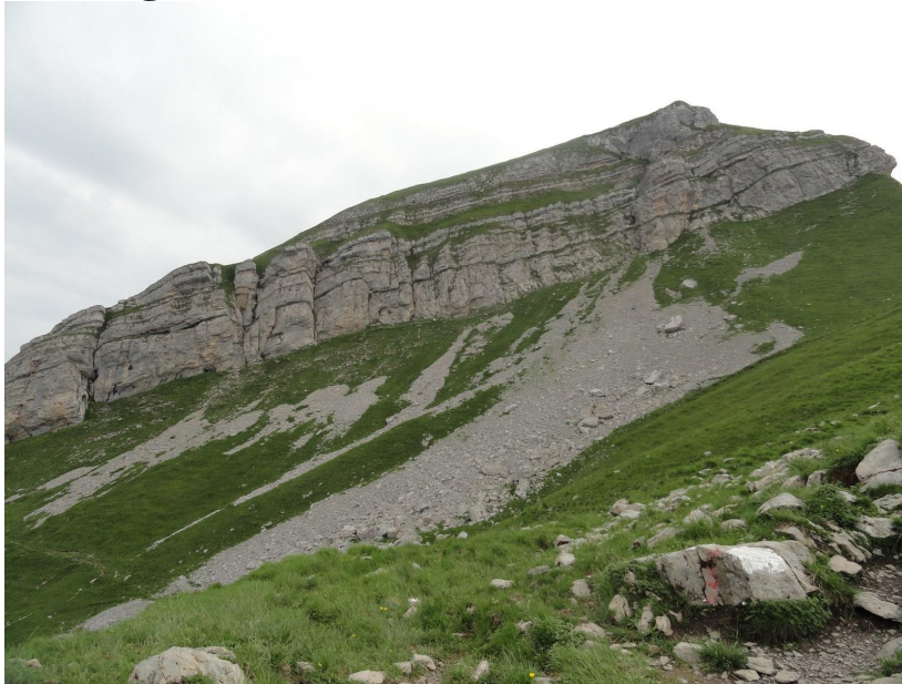
Fleubrig Diethelm, der Gipfelteil