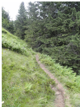
Es gab auch viele Alpenrosen