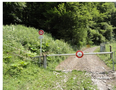
Die Strasse geht mit einer langen Traverse hoch, welche befahrbar wäre, aber die Signale sind klar.