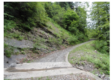
Traverse nach oben