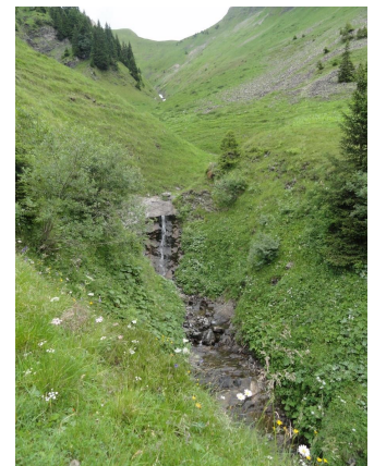
Der Weg geht oft einem Bach nach. Es gab genügend Wasser am 25 Juli.