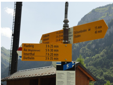
Fleubrig Diethelm 3h35

Vis a vis vom Golf-Platz fängt der Weg an, der Einstieg ist gut markiert.